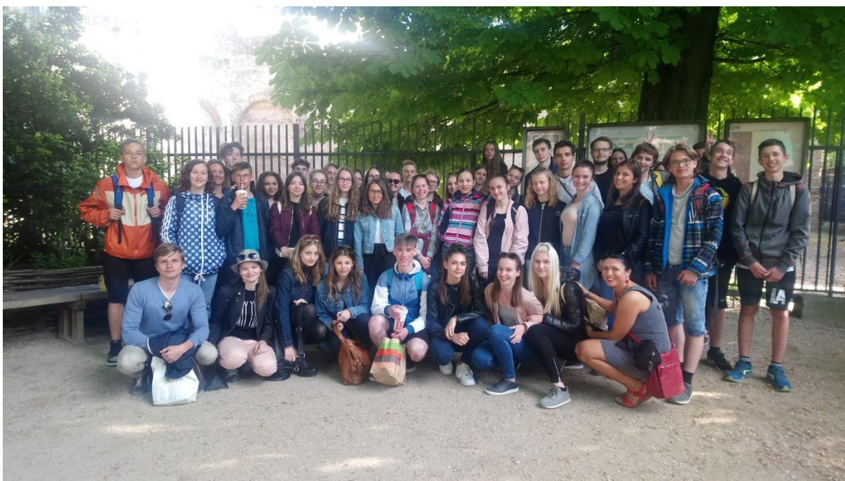
Parčík u muzea Cluny v Latinské čtvrti