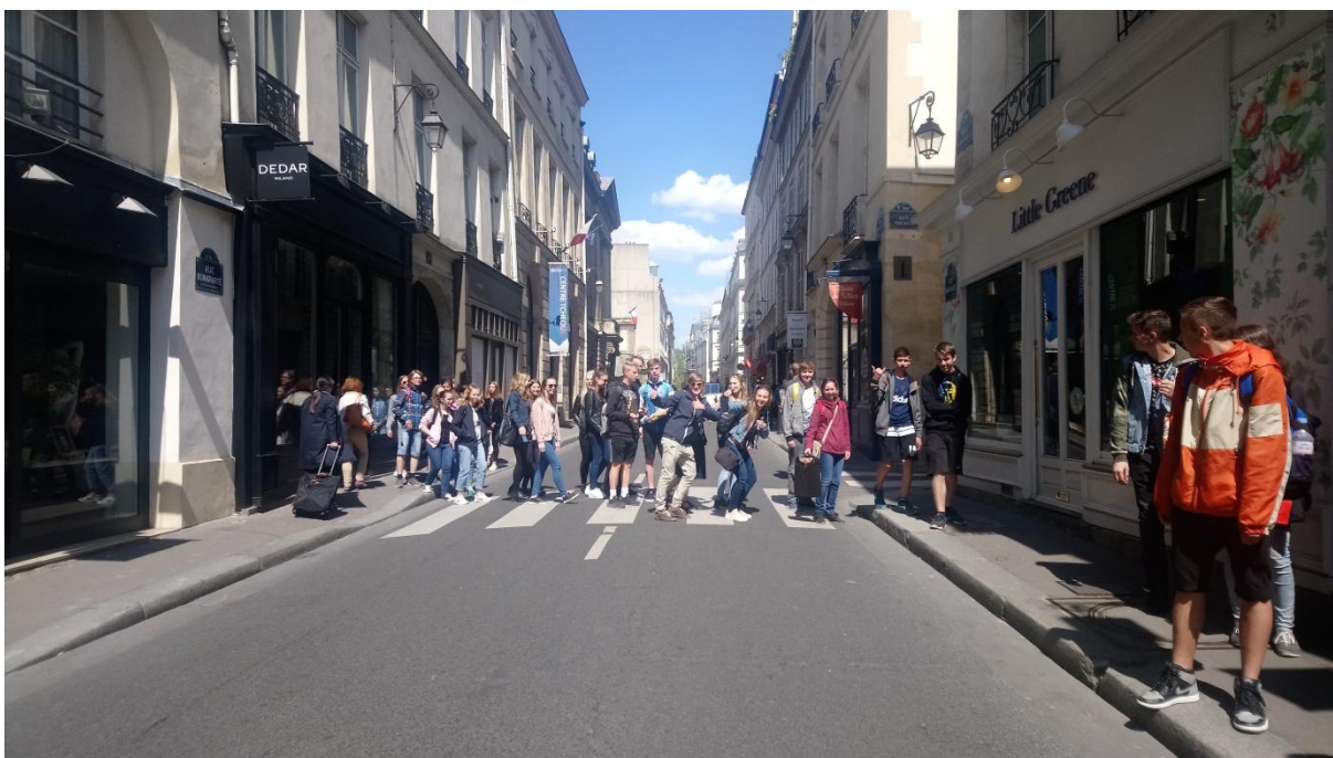
Ulice Bonaparte, před budovou Českého centra