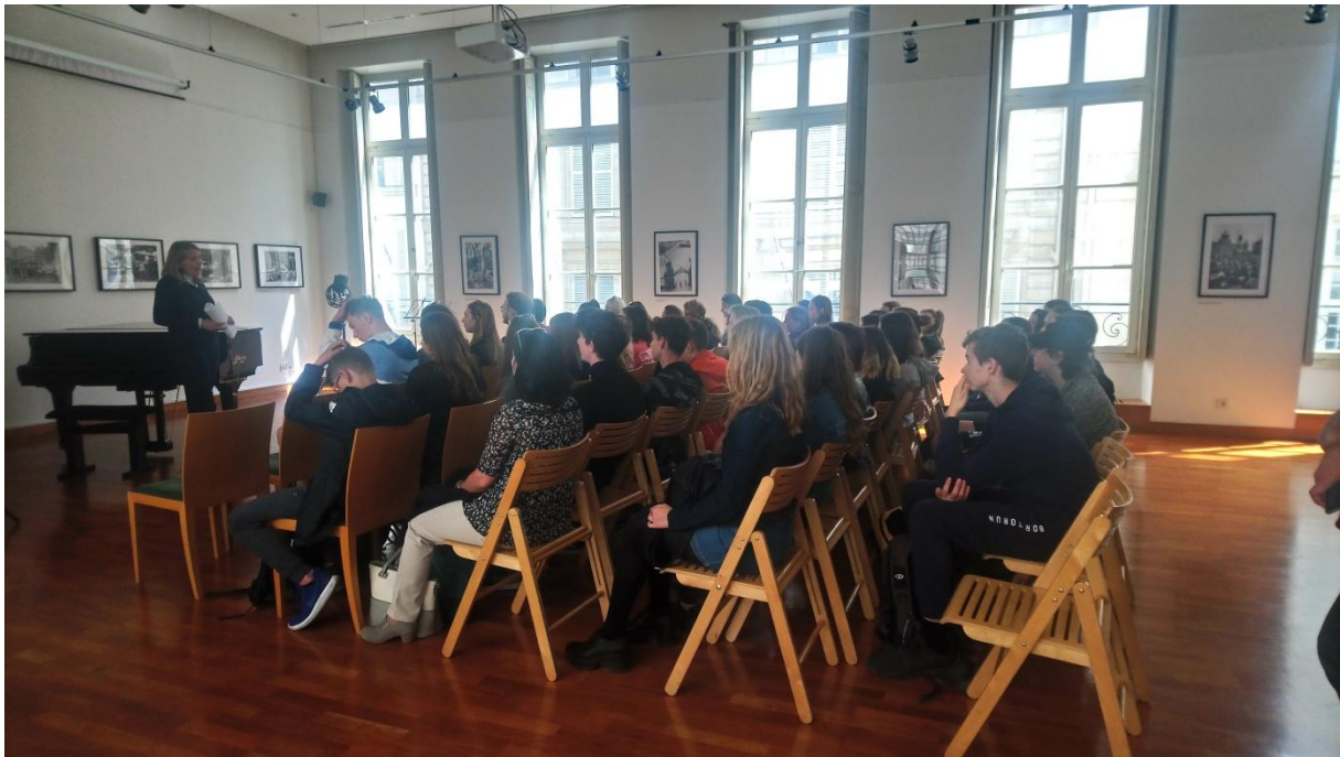
V koncertním sále Českého centra a dole plakát našich terciánů, který už visí na chodbách ČC