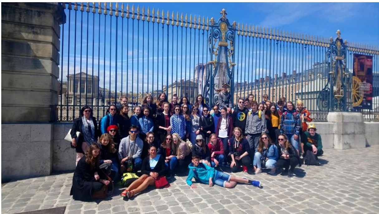
Před zámkem Versailles

Třetí den dopoledne nás čekal zámek Versailles. Už když jsme vjžděli do městečka stejného jména, byly vidět davy turistů čekajících fronty na nádvoří zámku. Ale bylo krásně, k čekání ve frontě nám svítilo sluníčko a náladu nám zvedal fakt, že fronta za námi rostla, ale ta před námi se zmenšovala. Nu, tak jsme to vydrželi a dostali se až do zámku a ze zámku do nádherných zahrad s fontánami a sochami. Versailles je nádherné místo a když si odmyslíte ty davy turistů, které jsou zde dnes a denně tak vás atmosféra pohltí a vtáhne do doby Ludvíka XIV. a vy můžete jako jeho dvorní zahradní architekt LeNôtre plánovat čím osázíte levý pruh cestičky kolem fontány či jako Molière, který se ve své hře chystá zesměšnit několik dvorních dam a to za Ludvíkova souhlasu.