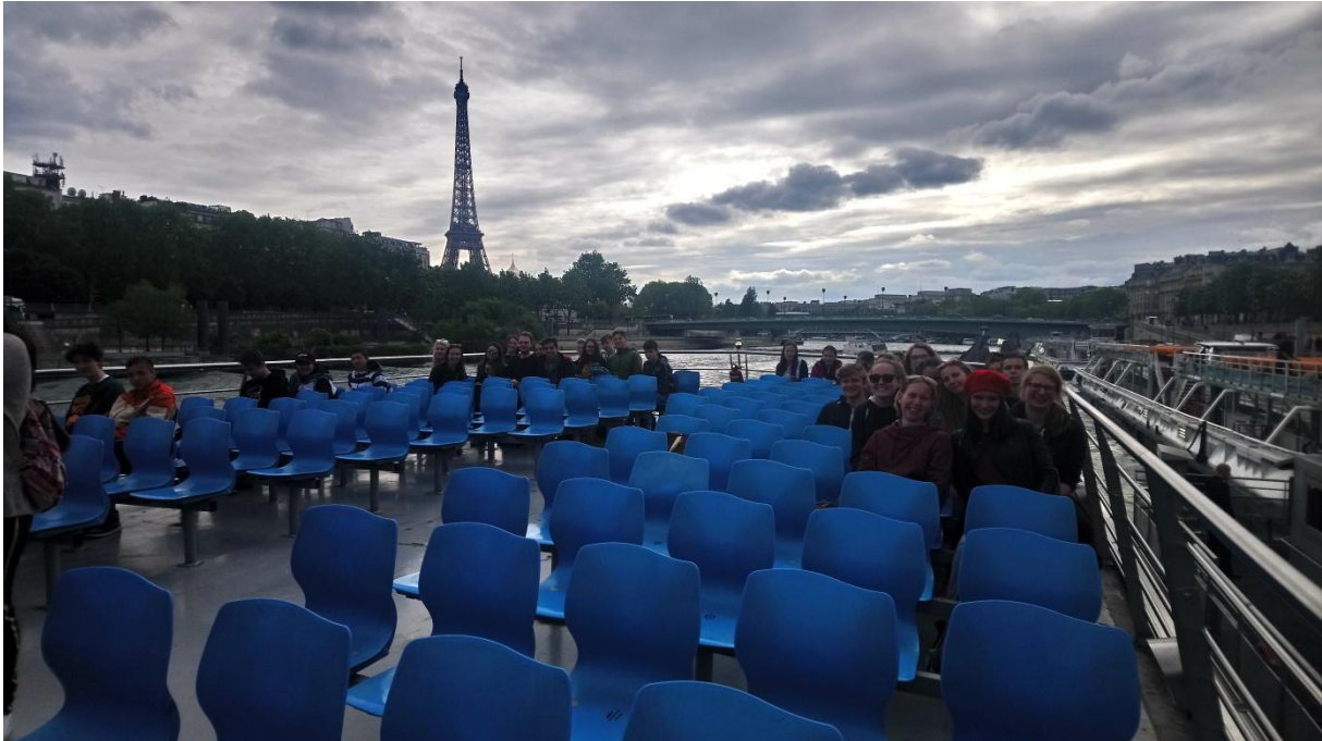
Podvečer na bateau-mouche

Odpoledne jsme pak naším autokarem přešli do pařížského Manhattanu, jak se přezdívá moderní čtvrti La Défense a den zakončili vyjížděnou po Seině na výletní lodi bateau-mouche. Z horní paluby do dolní nesešel snad nikdo, téměř všichni zůstali nahoře a prodýchávali podvečerní Paříž.