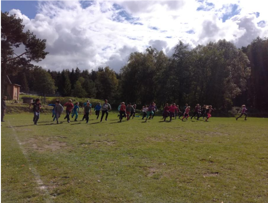
Prima v pohybu