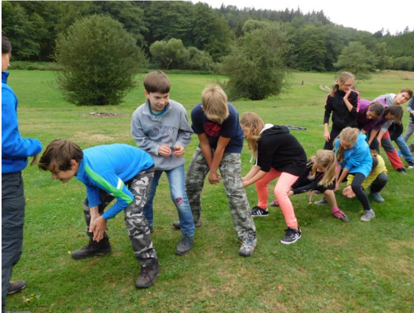
Spolupráce při posílání mýdla