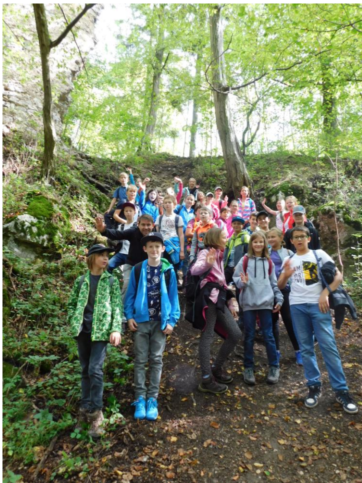
Výprava na Holštýn