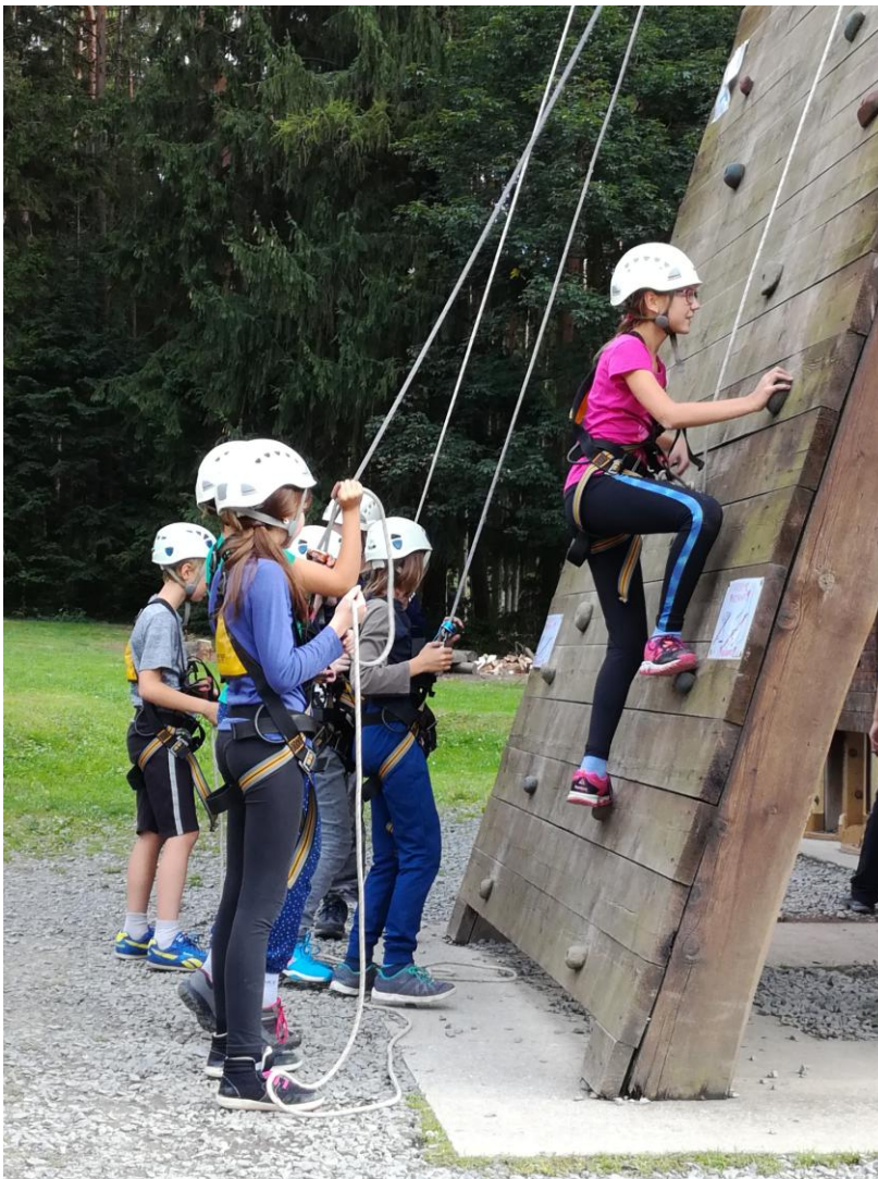
Na lezecké stěně