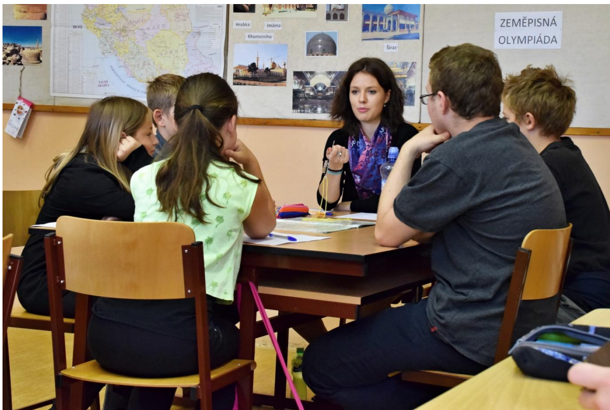
Orientace na mapě