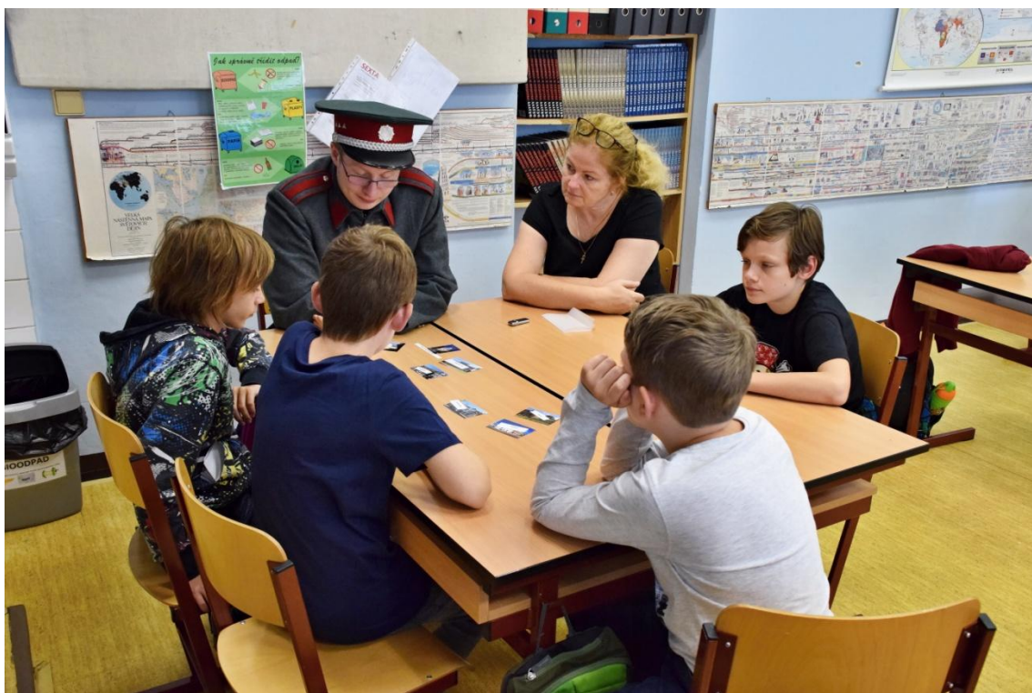
Beseda nad památkami Židlochovicka