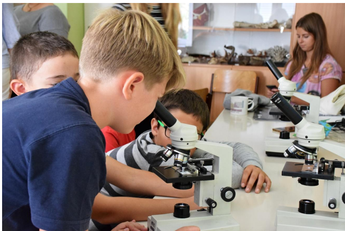
Práce s mikroskopem